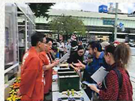
日本橋観光案内所