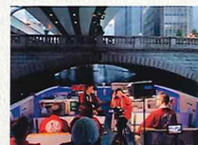
「日本橋ch」収録の様子

日本橋地域の魅力を発信する動画配信事業「日本橋ch」やお店の情報サイト「日本橋名店コレクション」の運用など