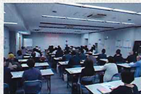
当委員会オリジナルセミナー