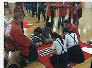
日本橋かるた大会

日本橋かるた大会の定期開催、日本橋かるたの普及活動、各種歴史文化イベントの開催など